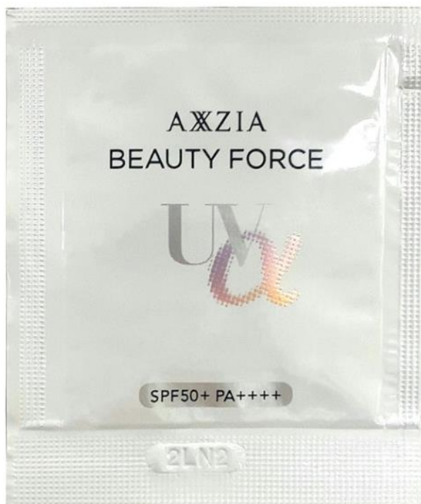
AXXZIA 隔離防曬乳液試用裝