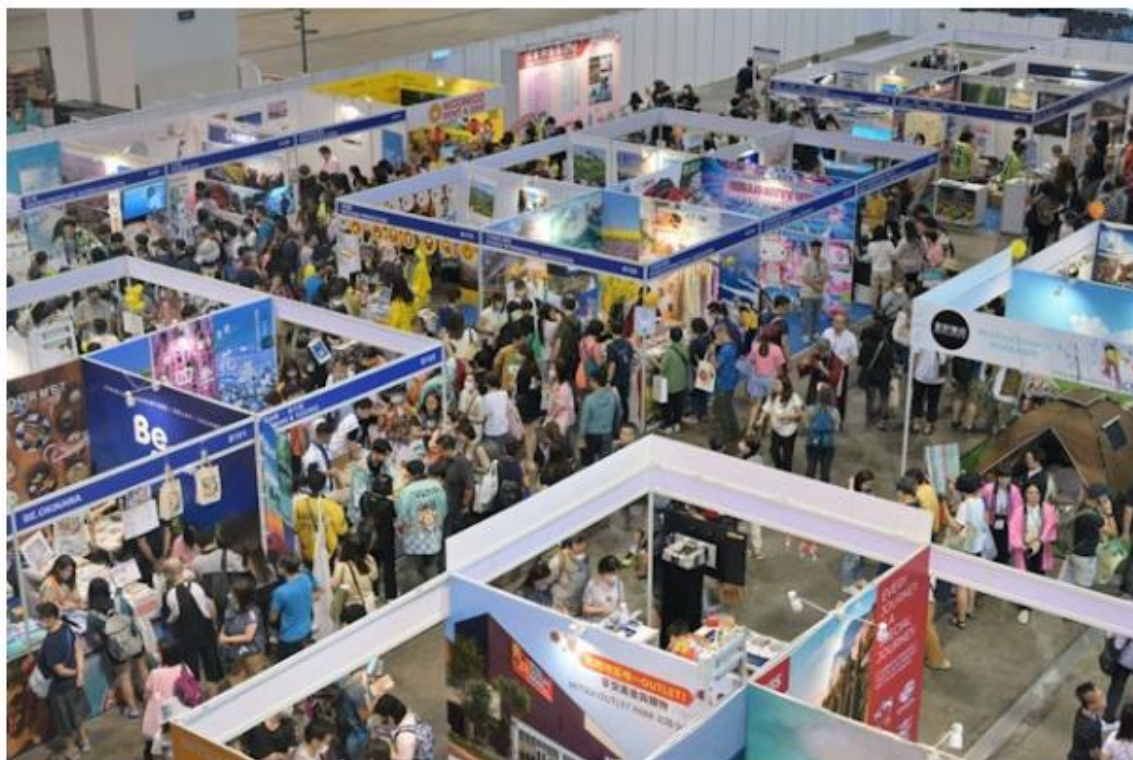
香港國際旅遊展將於6月13至17日舉行。