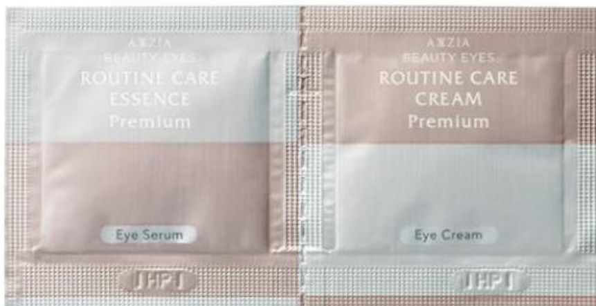
AXXZIA 4D抗糖眼霜+ 抗皺眼精華試用裝

AXXZIA (アクシージア) 是2011年創立的日本減齡抗糖化專家品牌，多款皇牌產品屢獲日本獎項，包括貴婦級抗糖美容飲品 #AGDrinkX，更被日本雜誌大力推薦，眾多女明星都有使用。福袋內有機會獲得AXXZIA隔離防曬乳液試用裝及4D抗糖眼霜+ 抗皺眼精華試用裝，體驗貴婦級抗糖美容產品！