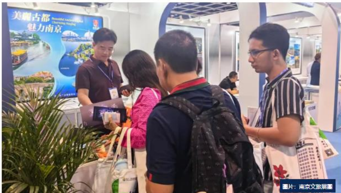
南京旅游形像推廣中心的研學系列產品也受到了參展商及市民公眾的關注

展會現場，玄武湖景區積極參與宣介洽談，先後與香港商報、港中旅、波蘭旅游局駐北京辦事處等媒體和展商代表進行了深度洽談，建立了合作聯系，拓寬了宣傳渠道。公眾日期間，玲琅滿目、特色鮮明、內涵豐富的玄武湖文創產品吸引了香港市民駐足南京展台諮詢互動，很多人表示一定要去南京看看這顆「金陵明珠」。作為我市常年主攻港澳入境市場的重點旅行社，江蘇金橋國旅在展會特別推出4條南京深度游線路產品，現場「吆喝」，與多家香港重點旅行商深度接洽，達成了合作意向。暑期將近，南京旅游形像推廣中心的研學系列產品也受到了參展商及市民公眾的關注。6、7月份，南京將迎來兩個百人規模的香港學生團組，在寧進行為期5天的深度研學之旅。