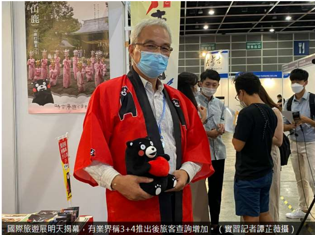
國際旅遊展明天揭幕，有業界稱3+4推出後旅客查詢增加。

香港國際旅遊展由明日起，一連四日在灣仔會展舉行。首一日半只供已登記的業界及專業人士入場，周五下午起開放予公眾購票入場。