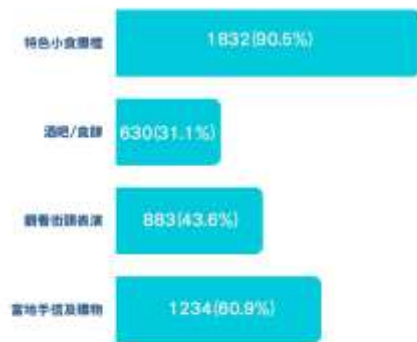
第1.3題：閣下去夜市會做甚麼？ (可選多項)